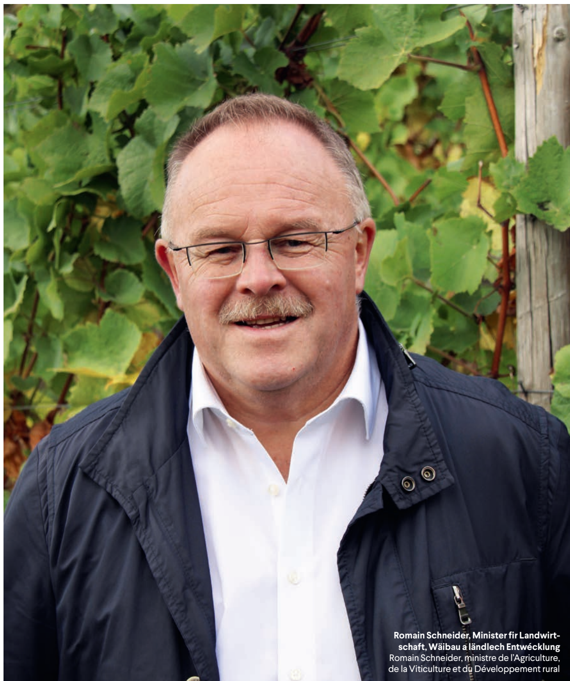
Romain Schneider, Minister fir Landwirtschaft, Wäibau a ländlech Entwécklung Romain Schneider, ministre de l'Agriculture, de la Viticulture et du Développement rural