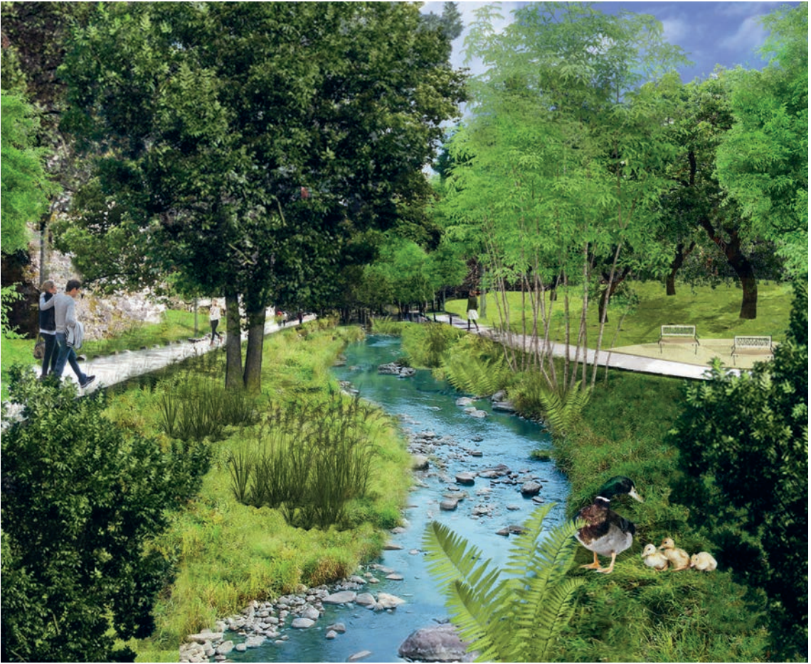
De Renaturéierungsprojet vun der Péitrus als computergeneréiert Biller Le projet de renaturation de la Pétrusse en image de synthèse