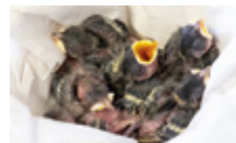
Oisillon sans plumage

Placez l'oiseau dans un endroit protégé à proximité immédiate (haie, branche, mur...). Les parents continueront à le nourrir jusqu'à ce qu'il prenne son envol.