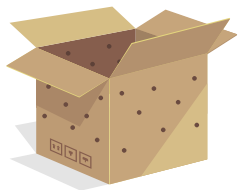
Boîte de transport foncée en carton avec des trous d'aération.