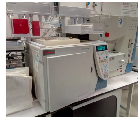
Doppelmassenspektrometer vom LIST in Belvaux, Luxemburg

werden vom Luxemburger Institut LIST in Belvaux durchgeführt, das als Dienstleister in diesem Projekt mitwirkt. Die EMR Vereinigung konnte sieben verschiedene Partnerorganisationen (Tabelle 1) aus fünf verschiedenen EU Ländern gewinnen, die freiwillig jeweils ca. 140 dokumentierte Milchproben bereitstellen werden.