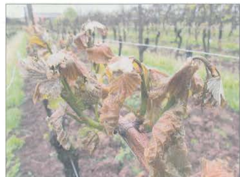
Abb. 4: Schadenssymptome in der Rebsorte Pinot gris (Aufnahme: Remich, 8.5.2019).

Als Folge dieser langen Frostphase kam es hier, sowie an vielen anderen Standorten entlang der Luxemburger Mosel, zu teilweise massiven Erfrierungen an den jungen Trieben. Am Standort Remich sind in den Versuchsfeldern des Weinbauinstitutes teilweise bis zu 100% der jungen Rebtriebe abgestorben (Abb. 3).