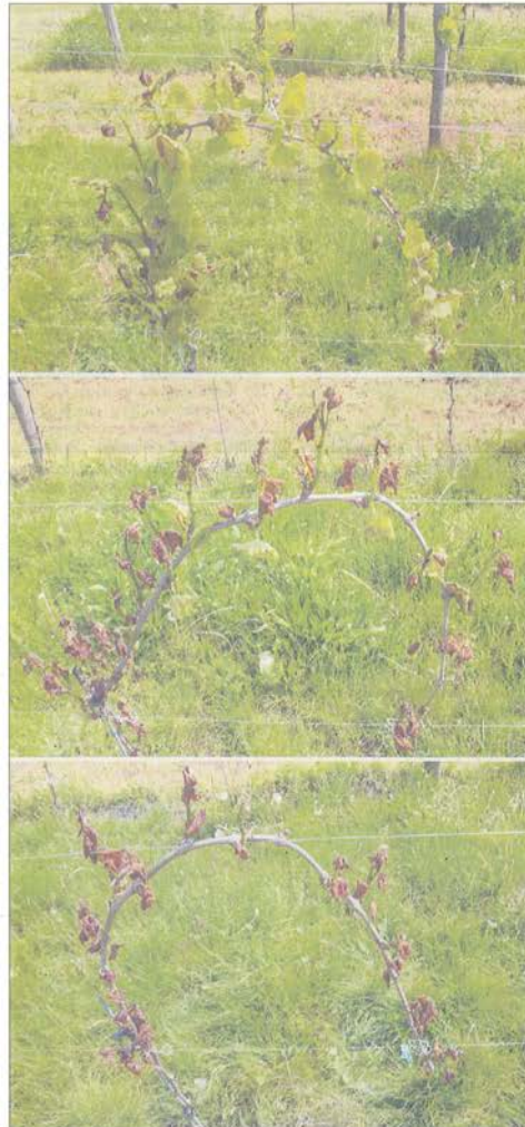
Abb. 5: Bogreben im oberen (oben), mittleren (Mitte) und unteren (unten) Bereich eines nur leicht hügeligen Muscaris-Weinbergs (Aufnahme: Remich, 14.5.2019).

jüngsten Blättern sowie den oberen Gescheinen (wobei der Haupttrieb teilweise noch grün verbleibt) (Abb. 4 auf Seite 7).