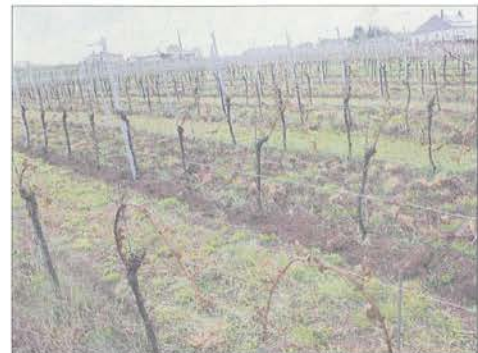
Abb. 3: Elbling-Parzelle am Standort Remich mit nahezu 100%iger Frostschädigung (Aufnahmedatum: 8.5.2019)

0^{\circ}\text{C} in 20 cm Höhe in der Nacht vom 4. auf den 5. Mai. Insgesamt herrschten am Standort Remich in 20 cm Höhe in dieser Nacht über zehn Stunden Temperaturen im Frostbereich vor.