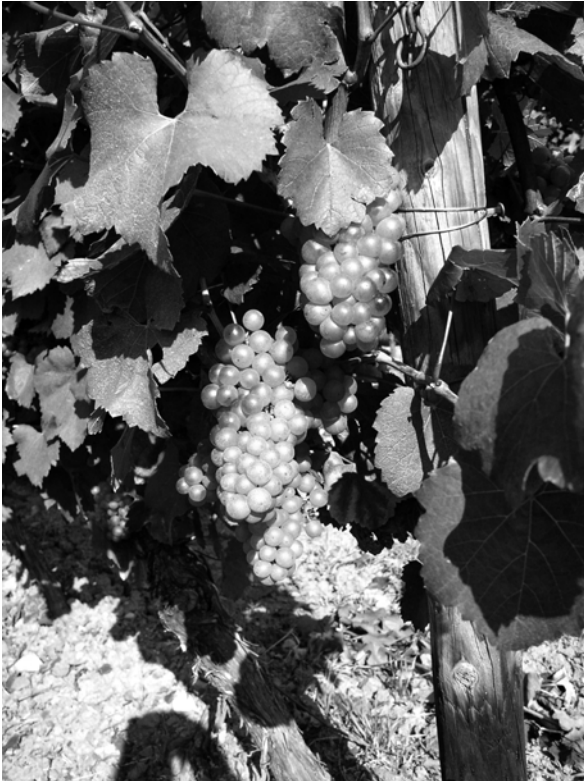
Abb. 2. Rebsorte Chardonnay, Herbst 2010 (Foto: Werner Hiller-König).

nen 104 . Inwieweit diese Indizien überzeugende Belege für die Existenz von Rebsorten sein können, soll in der Diskussion behandelt werden.